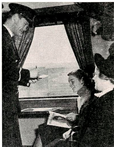
Tågkontrollör i arbete

göra som företagens kontaktmän med pressen, pressombud .